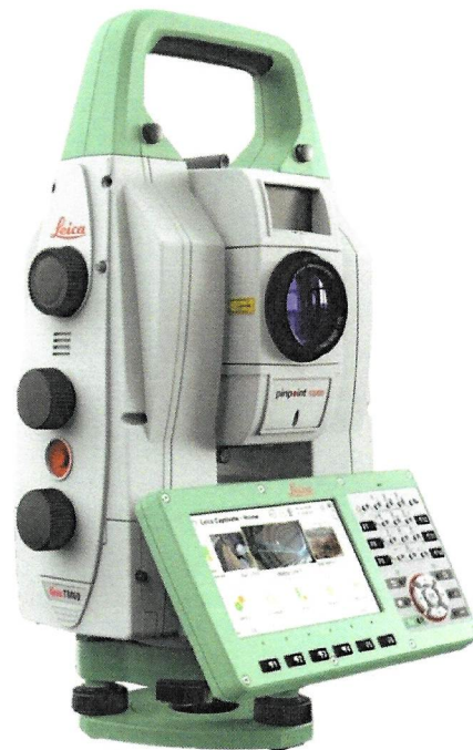
Рисунок 2 – Общий вид тахеометров электронных серий Leica TM60