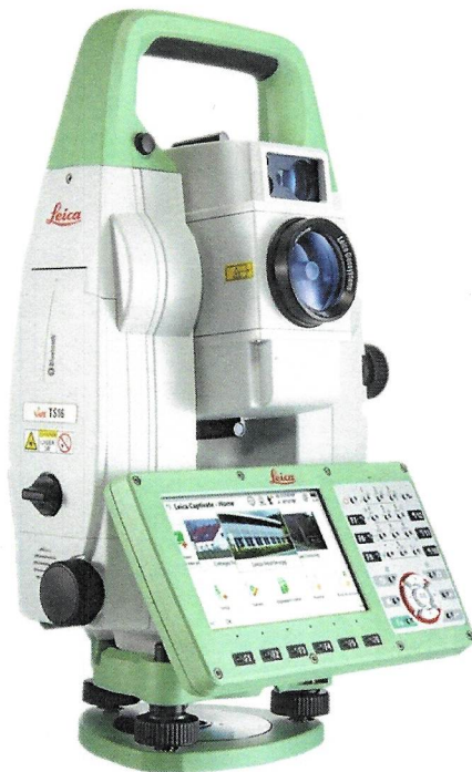
Рисунок 1 – Общий вид тахеометров электронных серий Leica TS16 P Arctic и Leica TS 16 G

Общий вид тахеометров представлен на рисунках 1-2.